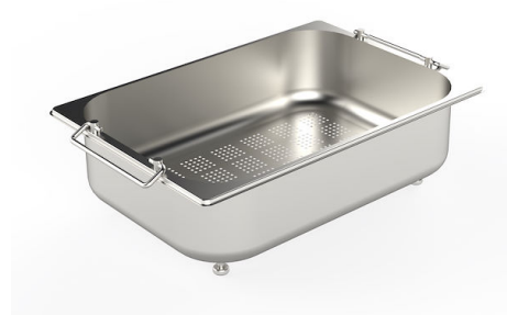
不锈钢爪篱 8154 000