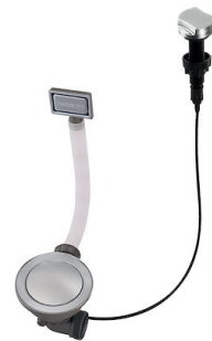
自动下水器 Space 8407 109