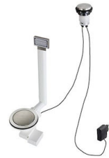
自动下水器 Space 8407 117