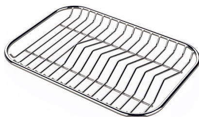
不锈钢背板 8100 154