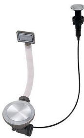
自动下水器 Space 8407 116