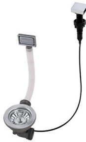
自动下水 8407 113